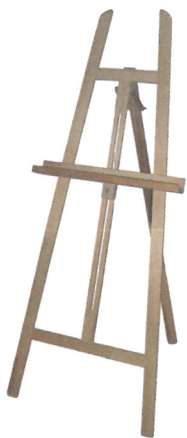
štafle (polní malířský stojan)