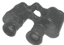
kukátko (toto je divadelní kukátko, malíř si ho dělal jen z prstů)