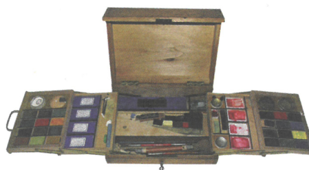
„málkastna“ (malířská skříňka)

Pomůcky z malířova slovníčku doplň do chybějících míst v textu. Zjistíš, které věci malíř používá, když maluje v přírodě.