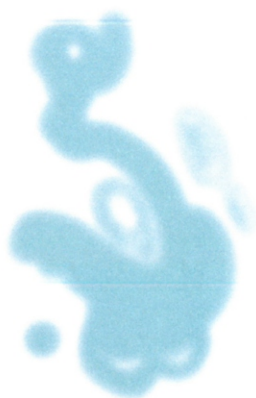
Salvador Dalí surrealista

obrazy Maxe Ernsta vznikaly technikou frotáže a koláže. Kterou z technik použil u tohoto díla?